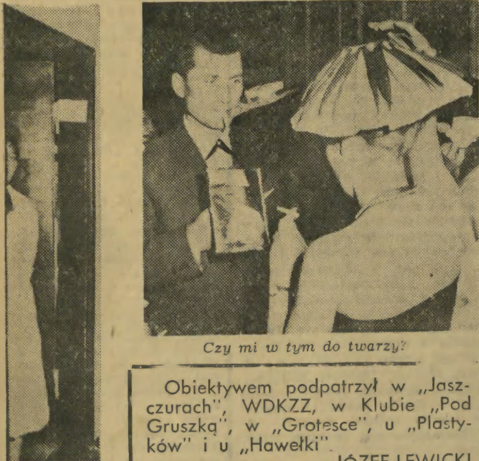
Czy mi w tym do twarzy?

Obiektywnie podpatrzył w „Jaszczurach”, WDKZZ, w Klubie „Pod Gruszką”, w „Grotosce”, u „Plastyków” i u „Hawelki”