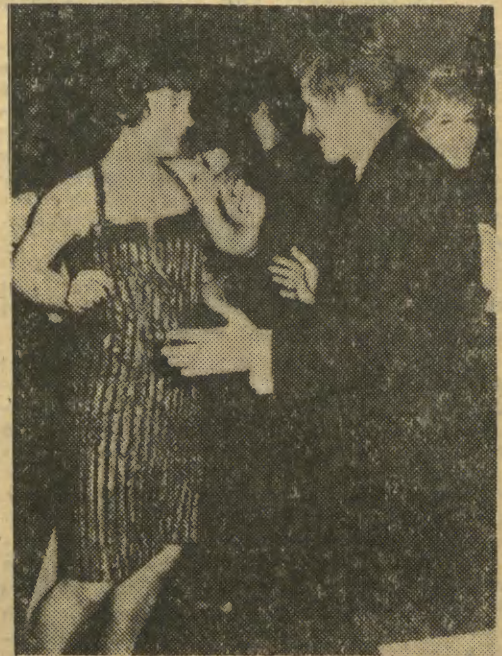
Twist, twist i jeszcze raz twist, panował niepodzielnie na wszystkich parkietach. Tańczono go na dużych salach balowych i na prywatkach, czasem na kilkudziesięciu kwadratach kwadratowych...