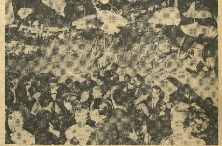
A oto już na balu. Pierwsze tańce, pierwsze znajomości...