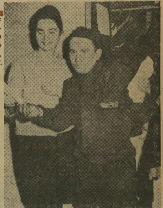
Cóż to za spotkanie? Kominiarz w Nowy Rok — murowane szczęście.

Nie wszyscy się bawią, niektórzy tylko przyglądają się w chwilach wolnych od obowiązków. Bo na przygotowanie trunków i zakąsek złożył się żmudny trud mistrzów sztuki kulinarnej.