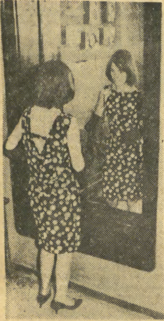
Ostatni rzut oka i drobne poprawki przed wyjściem na sylwestrowy bal. On już czeka...