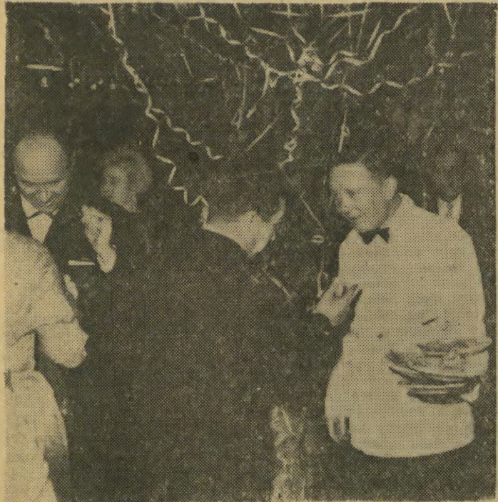
Ubytek kalorii trzeba uzupełnić schaboszekami...