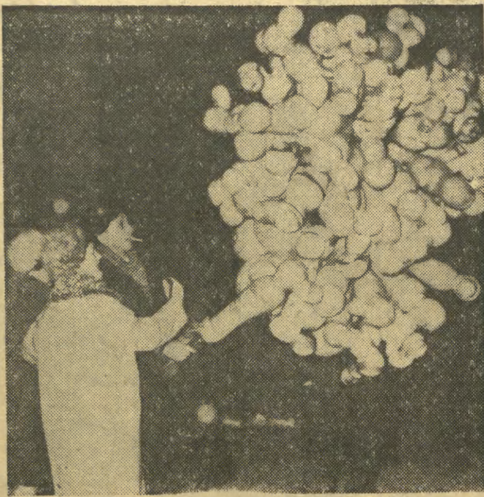
Baloniki, baloniki... to tradycyjny rekwizyt nowoocznego szaleństwa.