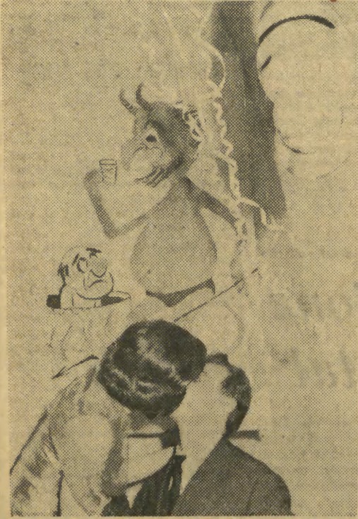
Sylwestrowy pocałunek nie jest grzechem. Wymowna symbolika dekoracji nikogo nie przeraża.