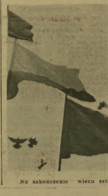
Na zakończenie wiecu setki gołębi wzbily się w powietrze.

Jutro Kraków będzie pod wpływem niżu Zachmurzenie duże z drobnymi opadami deszczu. W godzinach popołudniowych stopniowo zanikające opady z rozpożodzeniami. Rano zamglenia. Wiatr południowy i południowo-zachodni 3-7 m/sek. Temperatura nocą od plus 12 do plus 10, dniem od plus 14 do plus 18 st. C.