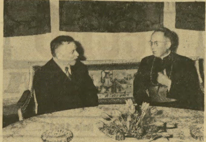
W dniu 2. V. 63 r. z-ca przewodniczącego Rady Państwa Bolesław Podedworny przyjął bawiącego w Polsce na zaproszenie kardynała S. Wyszyńskiego arcybiskupa Wiednia, kardynała F. Koeniga.

KAIR Z dniem dzisiejszym — 3 bm. — wszystkie banki w Syrii zostają znacjonalizowane. Decyzję tę opublikowano po wspólnym posiedzeniu gabinetu syryjskiego i Krajowej Rady Rewolucji Syryjskiej.