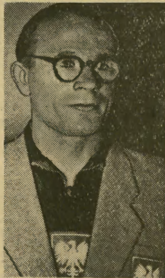
TRENER WL. WANDOR