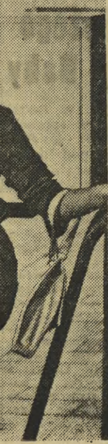
Zanim przebrzmiały echa afery Profumo...

Na przedmieściu Filadelfii około tysiąc biały rasistów usiłowało ukamienować małżeństwo murzyńskie, które chciało zamieszkać w nowym domu w dzielnicy „białych”.