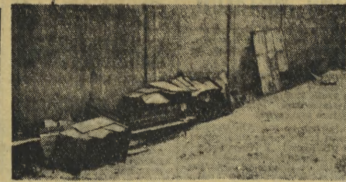
Mur otaczający Park Strzelecki rozebrano — i otworzył się taki oto estetyczny widok. Ciekawe tylko jak długo będzie on cieszył nasze oczy.

Jak wiadomo, konkurs jest przeznaczony dla przedsiębiorstw drobnej wytwórczości z naszego miasta — przemysłu terenowego, spółdzielni pracy, spółdzielni inwalidzkich, rzemieślników indywidualnych i spółdzielni cepliwskich. Dopuszczeni do udziału zostali wszyscy wytwórcy, którzy przekażą na adres zespołu organizacyjnego przy Wyz. Przemysłu RN m. Krakowa ul. 1-go Maja 3, IV p., pracę konkursową, opatrzoną hasłem: „Konkurs pamiątkarski” i godłem oraz dołączą oznaczoną tym samym hasłem i godłem kopertę z trzema egzemplarzami imiennego, szczegółowego opisu techniczno-ekonomicznego proponowanej pamiątki, z wymienieniem surowca użytego do produkcji, kosztów