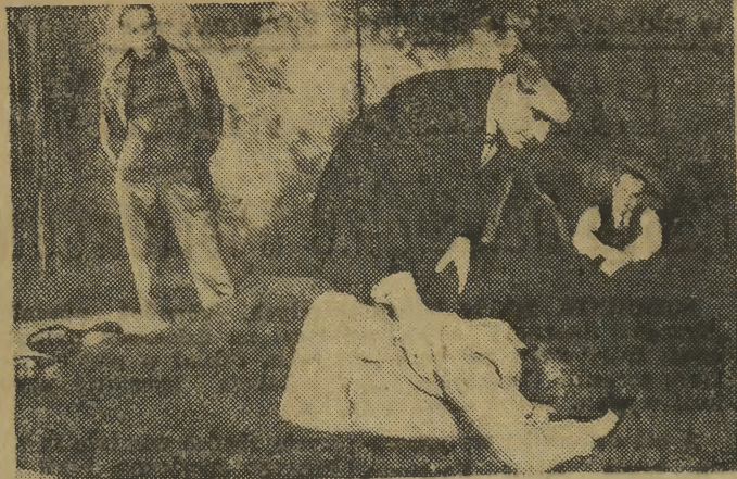
W sobotę 7 bm. odbędzie się ostatnie przedstawienie „Snu” T. Dostojewskiego - sztuki nagrodzonej na II Ogólnopolskim Festiwalu Sztuk Rosyjskich i Radzieckich. W niedzielę 8 bm. na

scenie Teatru Kameralnego będzie można po raz ostatni obejrzeć doskonałą sztukę S. Lenza „Dziwięciu bez wina”, z której zdjęcie zamieszczamy.