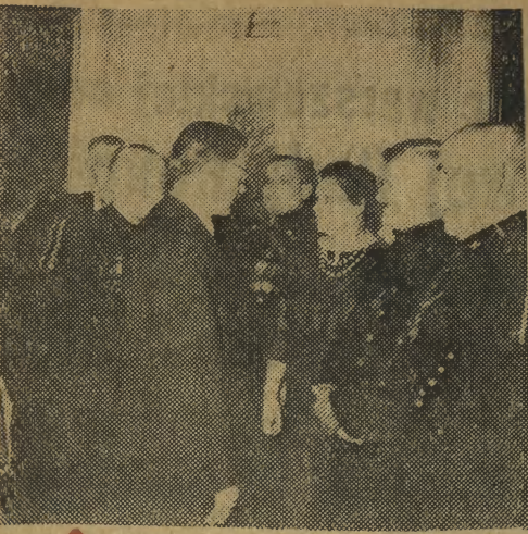
W dniu 2. XII. 1963 r. złożyli wizytę przewodniczącemu Rady Państwa — Aleksandrowi Zawadzkiemu starzy górnicy, z których wielu do dziś pracuje w kopalniach i których wielu synów pracuje również w górnictwie. Górnikom towarzyszyły małżonki.