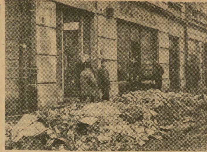
Niestawny to zwyczaj przedsiębiorstw remontowo-budowlanych, że wyroszony z budynku gruz gromadzą na chodniku zamiast natychmiast załadować na samochody i wywieźć za miasto, na usypisko. Oto przykład takiego postępowania przy ul. Stradom nr 23. Okazało się jednak, że sam widok fotoreportera, uwieczniającego sterę wystarczał; w ciągu b. krótkiego czasu gruz wywieziono a Stradom jest czysty jak rzadko.

Rok 1964 przyniesie zmiany na lepsze w sieci handlowej na terenie Krakowskiego. Na jej rozbudowę przewiduje się 87 mln zł. Oddane zostaną do użytku domy handlowe w Rabce i Bochni, pawilon handlowy w Krynicy i pawilon gastronomiczny w Nowym Sączu. W Krzeszowicach, Limanowej i Zatorze budowane będą domy towarowe, w Zabierzowie — gospoda. Wszystkie te obiekty wejdą do eksploatacji jeszcze w tym roku plus 120 sklepów typowych na wsiach. (mik)