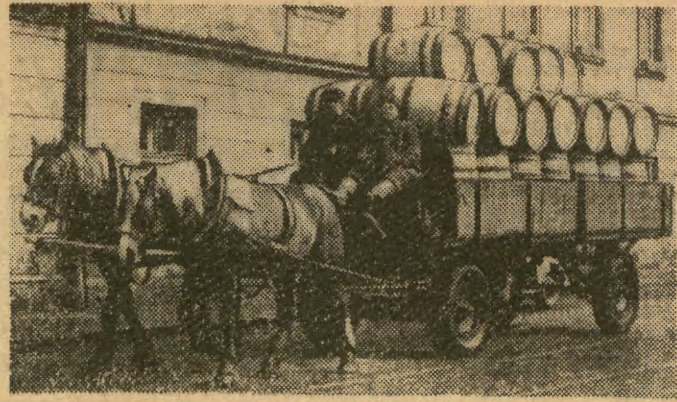
Jak za dawnych lat beczki do wina przewozi się najczęściej konnym platformem. Nadszedł już czas na zmotoryzowanie tego transportu.