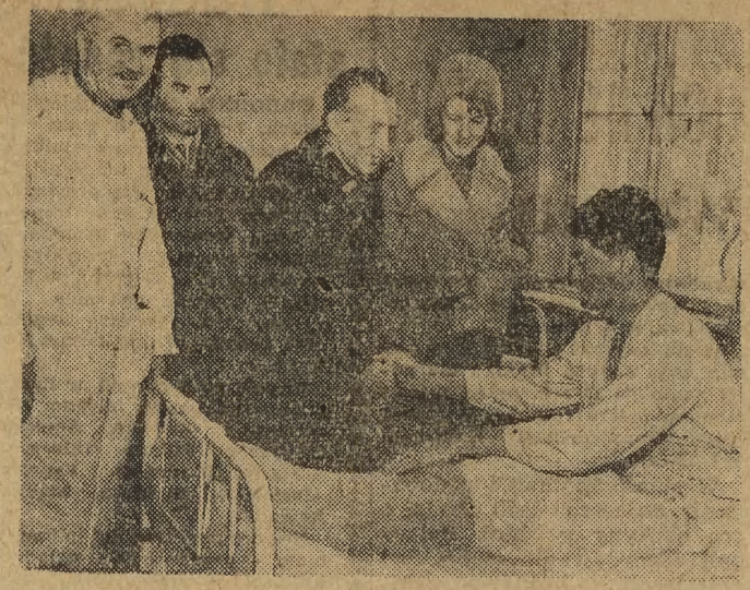
Jak co roku Liga Obrony Kraju nie zapomni o noworocznych podarunkach dla żołnierzy pełniących w noc Sylwestrową

Przed świętami, w ramach oszczędności, znacznie obcięto dostawy. W dniu Wigilii masy było w bród, ale wtedy już mało kto przygotowuje masy do tortów czy inne przysmaki.