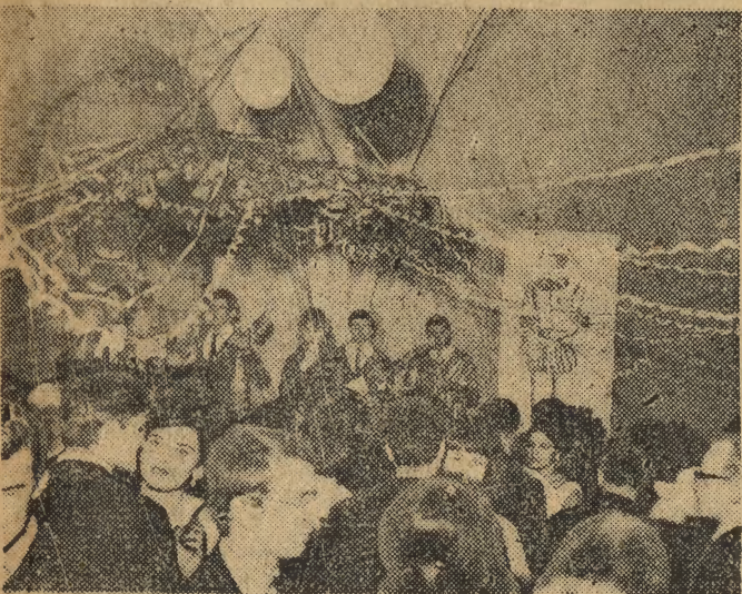
...tak też „Pod Jaszczurami”. Bawili się tu ubrani także na czarno młodzi dzień elmeni oraz błyszczące „srebrem i złotem” krakowskie studentki.