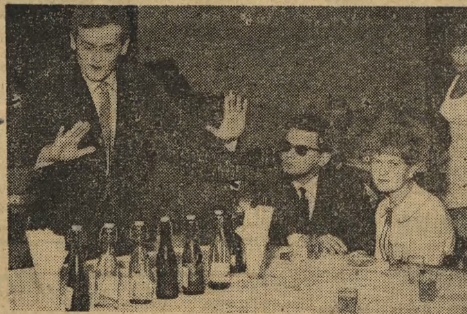
Studenci jak studenci. Kieszonki zawsze pusta, ale na wszystko jest rada. Można się dobrze bawić i przy szklance wody sodowej. Oto mistrz ceremonii dokonuje czarodziejskich misteriiów by zamienić 6 butelek wody w najprawdziwszego szampana...