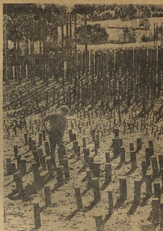
Jest to zapewne najdziałniejszy las świateł, a „rośnie” on w środkowej Szwecji i składa się ze słupów telefonicznych różnej grubości i wysokości. Zasadziło go szwedzkie przedsiębiorstwo budujące linie telefoniczne w celu sprawdzenia jakie drzewo i jakie środki impregnujące i konserwujące najlepiej zdają egzamin w terenie w tych warunkach.

PS. Nic co tu napisałem nie dotyczy hotelu „Merkury” w Poznaniu. Ale Poznań to wyjątkowe miasto. J. A.