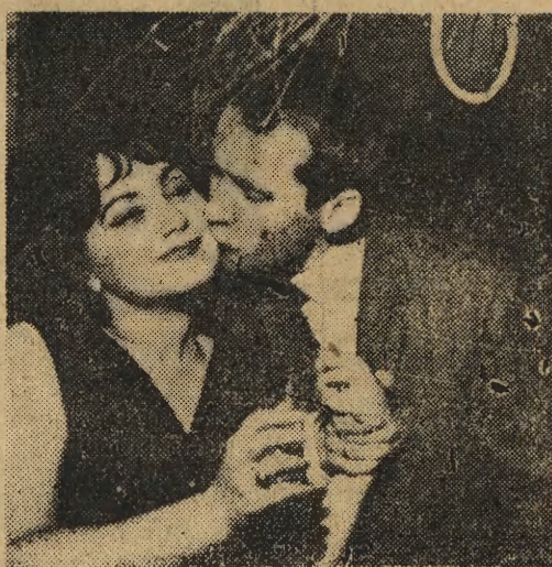
Zyczone sobie pomyślności, szczęścia i tysiąca innych przyjemnych rzeczy. Tak oto zawiązana została przyjaźń, która potwierdziła jeszcze raz, że Polak i Węgier to dwa bratanki. Uroczą budapesztanką wywiezie z pewnością masę wrażeń z nocy Sylwestrowej spędzonej w Krakowie.