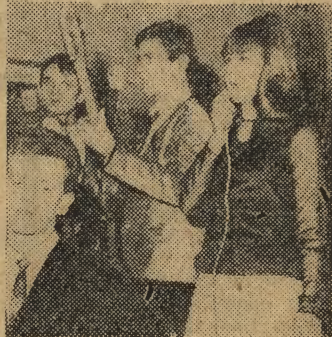
W wielu miejscach orkiestrom towarzyszyły występy wokalne młodych piosenkarek, które w rytm big-beatu uprzyjemniały sylwestrowe harce.

Szaleństwa Sylwestrowej nocy podpatrzył i obiektywem utrwalił — J. LEWICKI