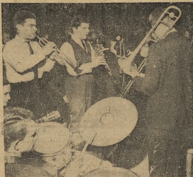
W pocie czoła pracowali również muzycy, którym w tę noc wypadło zabawiać sylwestrową publiczność. Gorąco było jak w piekle.