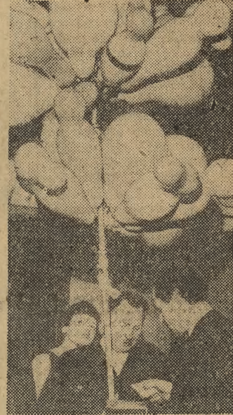
Jak Sylwester, to i balonik. W tym roku zaopatrzone je w okolicznościowe napisy „Dosiego Roku 1965”.