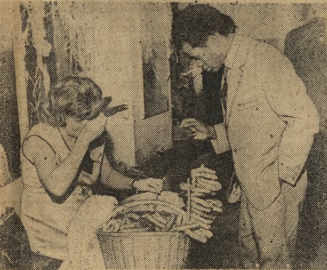
Ze tegoroczny Sylwester był bardzo elegancki świądzy o tym chociażby wieczorowy strój sprzedawczyń precli.