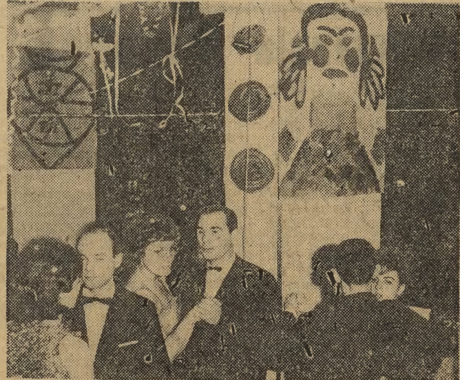
Panów obowiązywał czarny strój, śnieżnobiała koszula i wąska muszka. Panie — jak co roku — w zgodzie z wymogami karnawalowej mody.