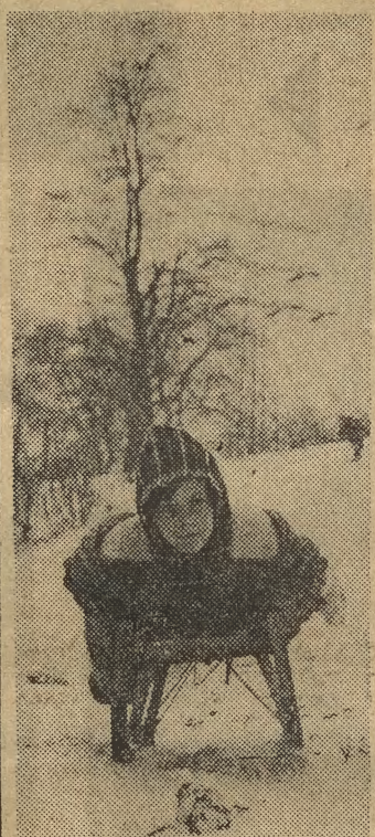
Wreszcie można korzystać z uroków zimy...

W kilku sklepach zauważyłem luksusowo wykonaną planszę z tekstem: „Stoisko obsługuje dwu pracowników”. W każdym z tych sklepów była kolejka jak diabli i obsługiwał tylko jeden pracownik. Czy MHD wymyśliło środek na niewidzialność? Dlaczego nie informuje się np. „Dziś sprzedajemy nylonowe biustonosze”? Czy rzeczywiście był drugi pracownik? A jeżeli tak — to co się z nim stało — może go wyrzucili za pijaństwo i biedna żona z czworgiem dzieci nie ma na chleb? A może zatrzasnął się gdzieś w windzie i grozi mu śmierć głodowa? A może wyszedł do Sukiennic do wc, po drodze stracił pamięć i już do końca życia będzie się błąkał po świecie szukając ciepła rodzinnego i równie pomysłowego jak MHD pracodawcy? Ech, życie to nie malina, nie rośnie pod piotem... (j)