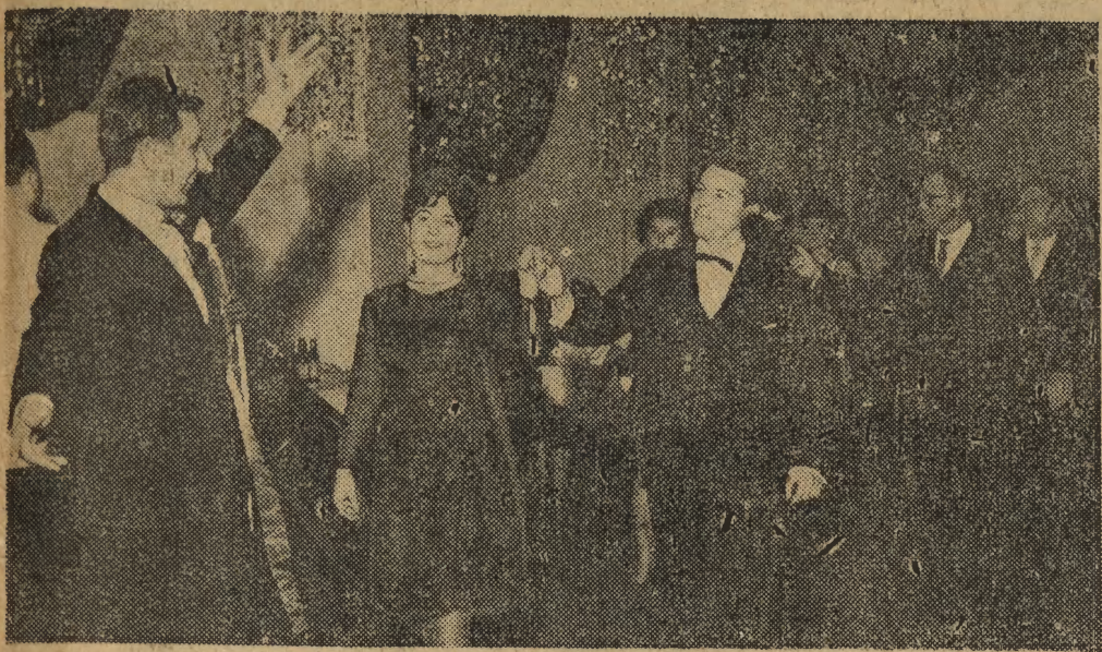
Nie twistem ani rock'em, lecz polonezem rozpoczynano w tym roku wiele sylwestrowych zabaw. Tak np. wyglądał on w wykonaniu wychowanków Uniwersytetu Jagiellońskiego w sali Muzeum Narodowego przy al. 3 Maja.