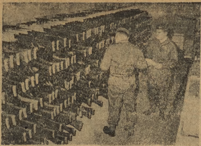
W związku z zaostrzeniem się sytuacji w Malajzji, Wielka Brytania wysłała dodatkowe kontyngenty wojska na Daleki Wschód. Piechota morska i spadochroniarze przetrucami drogą lotniczą. Na zdjęciu: żołnierze II batalionu spadochronowego pobierają przed odlotem broń w koszarach w Aldershot w hrabstwie Hampshire.

odbędzie się 18 bm. Bilety w cenie 20 zł można nabywać od środy 6 bm. w Dziele Łączności z Czytelnikami „Echa” (Wiślna 2/29), tel. 542-53.