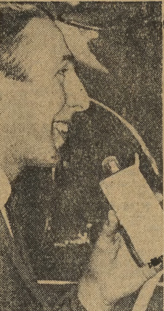
Znana firma elektroniczna „Grundig” z NRF wypuściła ostatnio na rynek magnetofon „Notatnik”. Kieszonkowy magnetofon jest połączony z miniaturowym mikrofonem. Na zdjęciu: próba nowego magnetofonu.