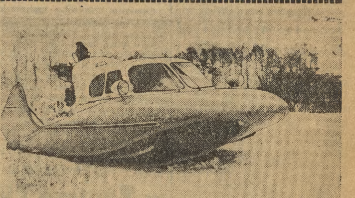
Grupa młodych inżynierów-konstruktorów radzieckich, pracująca pod kierownictwem słynnego prof. Tupolewa (konstruktora samolotów), zbudowała oryginalny pojazd-amfibię. Są to sanie-amfibie, które z jednakową łatwością poruszają się po śniegu, lodzie i wodzie. Pojazd osiąga na wodzie szybkość 70 km na godzinę, a na śniegu 110 km na godzinę. Pierwsza seria 25 sani-amfibi zostanie wkrótce oddana do eksploatacji. Na zdjęciu: nowy pojazd na śniegu.

Z okazji rozpoczęcia sesji 89 Kongresu USA — odbyć się ma manifestacja zwolenników integracji rasowej należących do Demokratycznej Partii Wolności.