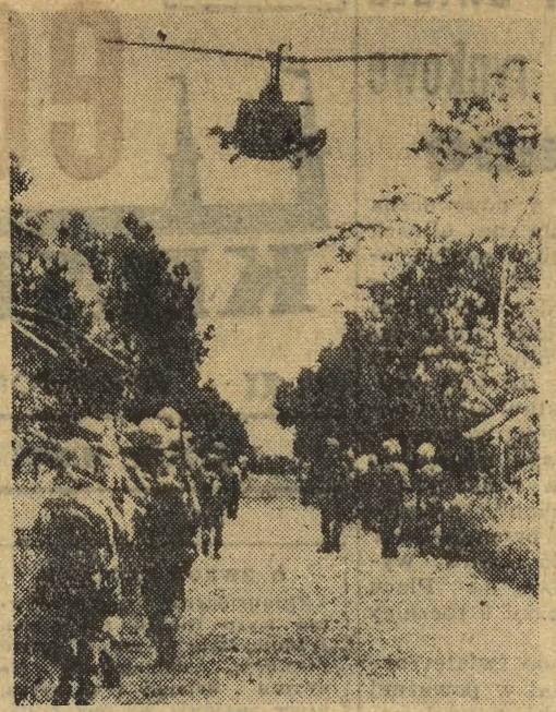
W Wietnamie poludniowym zakończyła się sześciodniowa bitwa w rejonie Binh Gia. Bitwa ta kosztowała Wojska rządowe ponad 300 zabitych. Poległo także 12 amerykańskich „doradców wojskowych”. Straty partyzantów oceniane są na około 100 zabitych. Jednocześnie w Saigonie wybuchły nowe rozruchy. Budźcy zdecydowali podjąć na nowo walkę przeciw rządowi. Demonstracje trwają. Na zdjęciu: wojska rządowe wycofują się w kierunku Saigona po zakończeniu operacji w rejonie Binh Gia. Operacja ta została uznana nawet przez źródła amerykańskie za „porażkę prestiżową” rządu Tran Van Hounga.

Rząd radziecki uważa — pisze Gromyko — że wszyscy uczestnicy porozumień genewskich obowiązani są „podjąć niezbędne kroki i udaremnić niebezpieczne plany soldierskiej amerykańskiej, zmierzające do rozszerzenia agresywnej wojny w Indochinach”.