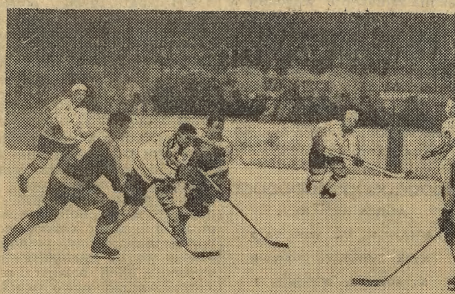
Na zdjęciu fragment zawodów hokejowych Polska — Norwegia rozegranych na sztuczny lodowisku w Nowym Targu.

zawody łyżwiarskie w jeździe szybkiej na lodzie. Wśród kobiet pierwsze miejsce zdobyła Mroske (Orzeł) przed Bionką (AZS AWF) i Pilejczyk (Olimpia Elbląg), a wśród mężczyzn Kuch (Legia) przed Świąciekim (Legia) i Kowalczykiem (Olimpia Elbląg).