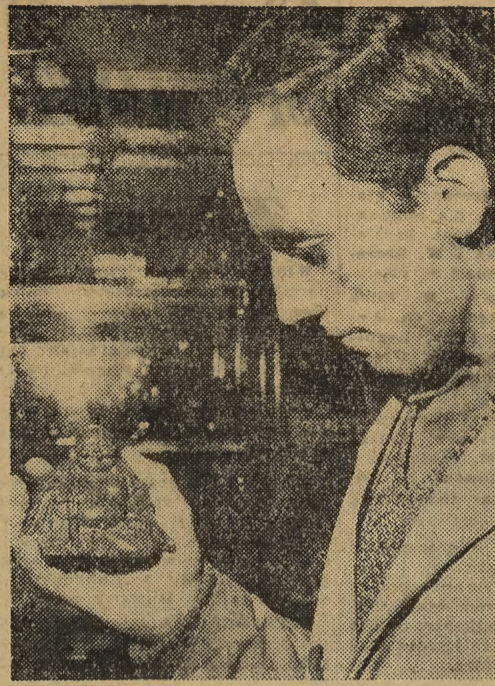
Posiadanie w do- mu posażka ko- ralowego Buddy przynosi podob- no szczęście — stąd czerwony Buddha jest po- szukiwany w sklepach z anty- kami.

ORGANIZACJA ORMO- wska w Krakowie zrzesza ponad 15 tys. członków, specjalizujących się w za- gadnieniach utrzymania por- ządku na drogach, wod- nach, zwalczania przestę- pczosci młodocianych itp.