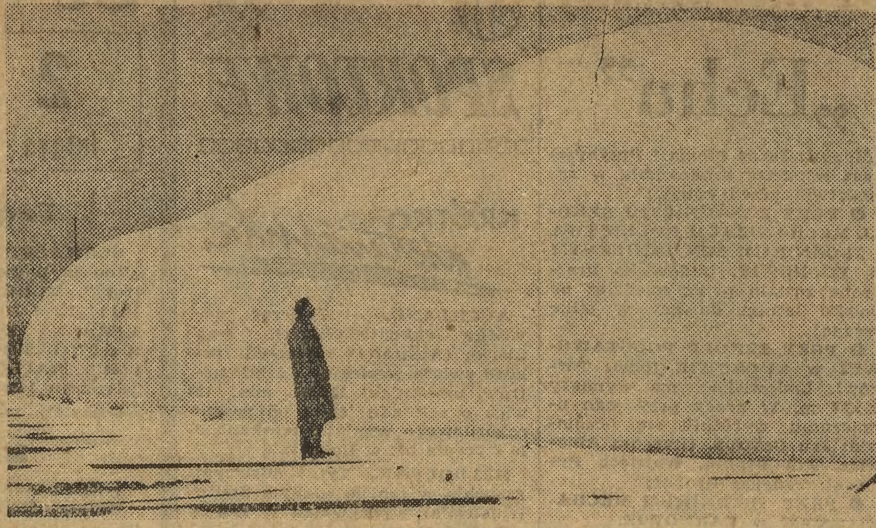
Wielki namiot rozbito w Krakowskiej Stoczni Rzecznaj.

Nad basenem portowym w obrębie Krakowskiej Stoczni Rzecznaj rozbito został wielki namiot, o wymiarach: 36 m długości, 12 m szerokości i 6 m wysokości. Z oddali namiot przypomina do złudzenia — nadęty balon, przytwierdzony do ziemi za pomocą lin i łańcuchów. Obok balonu zaistniało urządzenie, pracujące na zasadzie obrzynie... suszarki do włosów. Bez przerwy przez kilkanaście godzin dziennie, tłoczono jest do wnętrza balonu gorące powietrze. We wnętrzu balonu, na specjalnej podbudowie, ułożono stalowy kadłub statku pasażerskiego — pierwszego, który powstaje w Krakowskiej Stoczni Rzecznaj, a przeznaczonego do żeglugi po kanałach i jeziorach od Elbląga do Ostródy. Pewną część swej przyszłej trasy statek będzie pokonywać drogą... lądową, ułożony i wieziony wraz z pasażerami (jednorazowo będzie mógł zabrać 75 osób) na specjalnych wózkach. Konstrukcja statków przystosowana zostaje do potrzeb tej oryginalnej trasy