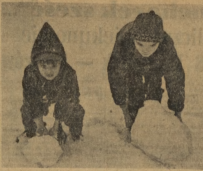
Wreszcie jest z czego zbudować wielkiego kąpieliska.