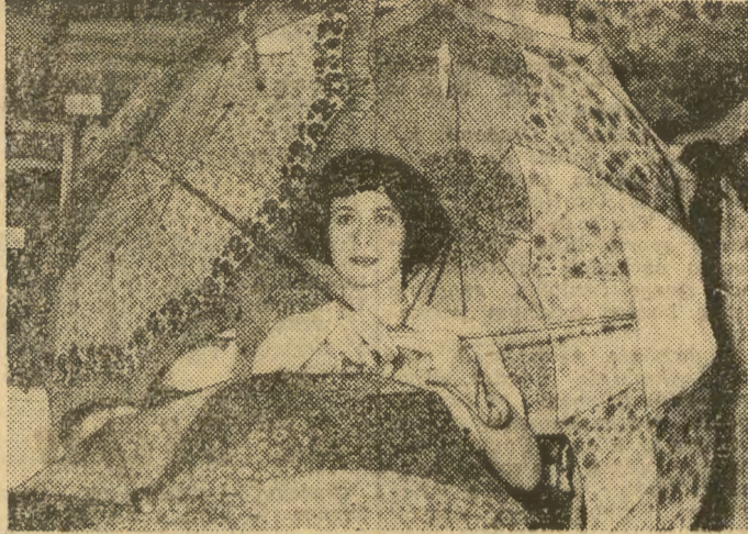
Uwagę zwiedzających i Krakowicz Targi Jesienne w hali sportowej „Wawelu” przy ul. Zwierzynieckiej przyciągała barwna parasolki przeciwdeszczowe. Są to...