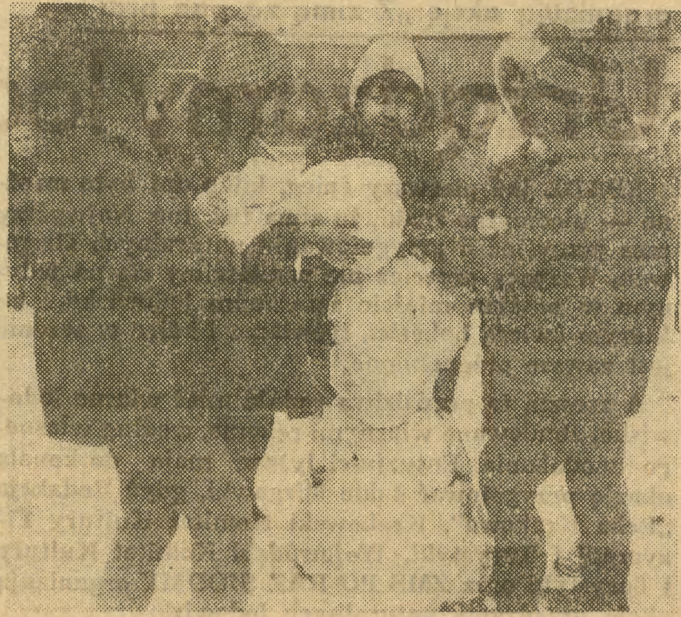
Wiele radości sprawił dzieciom pierwszy tegoroczny śnieg. Nie obyło się naturalnie bez lepienia bałwana.

Przy końcu rozmowy z pry- musem (który w Dniu Pod- chorążego pełni rolę komend- anta szkoły i garnizonu) py- tam o wrażenie, jakie na nim