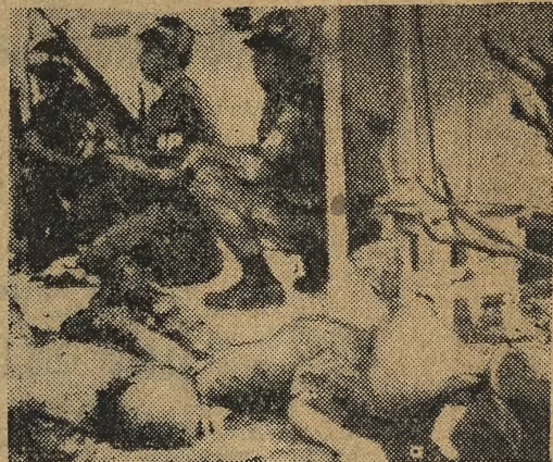
Żołnierze USA zaskoczeni atakiem partyzantów

Miasto Pleiku wzięte szturmem przez partyzantów