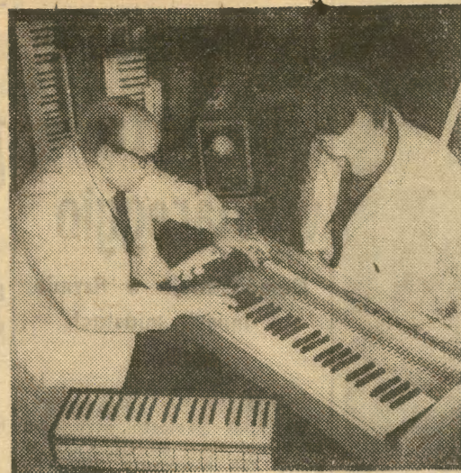
INSTRUMENTY ELEKTRONOWE Z BYDGOSZCZY Istniejąca już od dziesięciu lat Bydgoska Fabryka Akordeonów — jedyny w kraju producent tych instrumentów, dorównujących jakością włoskim i niemieckim, została w ostatnim okresie poważnie rozbudowana. Pozwoli to na podniesienie produkcji o ok. 40 proc. W przyszłym roku Bydgoską Fabrykę opuści 22 tys. akordeonów i gitar elektrycznych. W przygotowaniu jest też nowy typ akordeonu „Kujawiak”, wyposażony w specjalną komorę rezonansową. Drugą specjalnością Bydgoskiej Fabryki Akordeonów są instrumenty elektroniczne, które znakomicie imitują brzmienie niemal całej orkiestry. Do nich należą będzie ulepszona wersja uniwersalnego „Tranzistonu II”. Będzie on mniejszy, a więc wygodniejszy od pierwowzoru. Jego walory głosowe i koncertowe uzyskały wysoką ocenę muzyków. Na zdjęciu: w biurze konstrukcyjnym Fabryki — przy instrumentach elektronicznych „Sonatina” i „Tranziston II”.