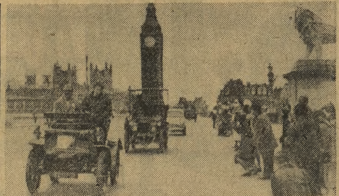
3 bm. odbyły się na trasie Londyn — Brighton wycieczki samochodów-weteranów. Oto dwaj starszakuwie z początków naszego stulecia na Westminster Bridge w Londynie.