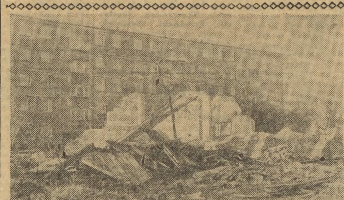
Kraków rozrasta się ostatnimi czasy niezwykle intensywnie, wypierając z dzielnic peryferyjnych stare małe domki...