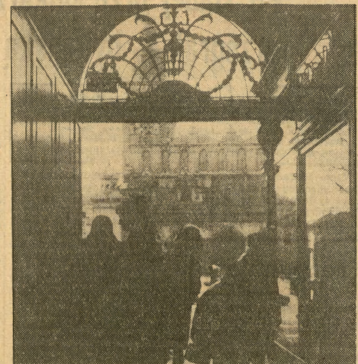
RYNEK INACZEJ. Liczne stęte zabytkowych kamienie Rynku Głównego, dzięki gablotom i drobnym punktom sprzedaży — tętnią życiem. Oto rzut oka z głębi jednej z takich bram.