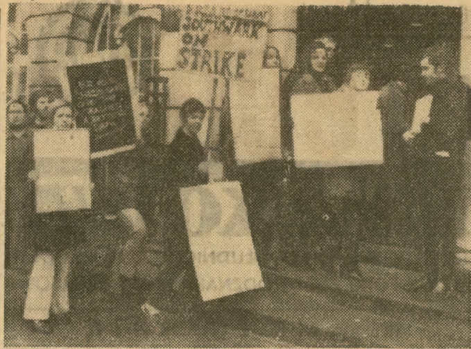
1 bm. nauczyciele londyńscy rozpoczęli dwutygodniowy strajk domagając się podwyższenia plac. Na zdjęciu: grupa strajkujących pikietuje gmach związku zawodowego nauczycieli brytyjskich.