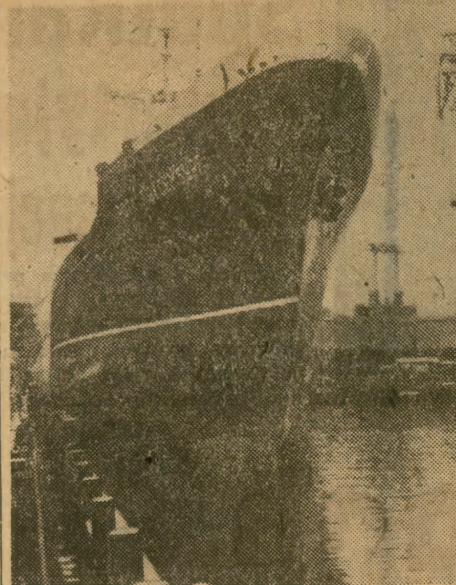
2 bm. w Stoczni Gdańskiej im. Lenina, odbyła się uroczystość podniesienia bandery na drobnicowcu „Róża Luksemburg”, zbudowanym na zlecenie armatora radzieckiego. W przekazaniu do eksploatacji statku mieści się symboliczna 3-milionowa tona nośności, zbudowana przez polski przemysł okrętowy dla zagranicznych odbiorców. Na zdjęciu: „Róża Luksemburg” przy nabrzeżu stoczniowym.