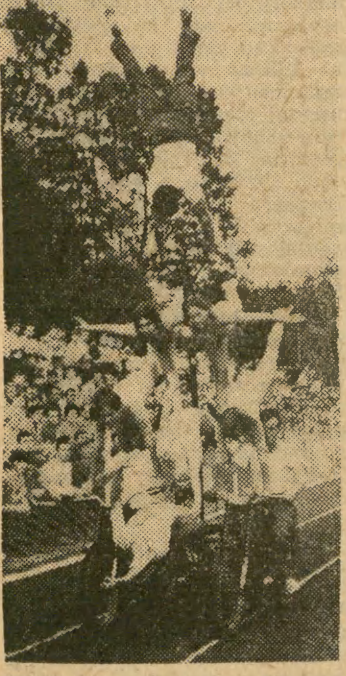
W Prudniku istnieje jedyna w Polsce sekcja akrobatyki motorowej — LKS „Zarzewie”. Na zdjęciu: pokazy akrobatyki motorowej na stadionie w Kluczborku.

Boński korespondent „New York Times” pisze, że wiadomość o dewaluacji franka