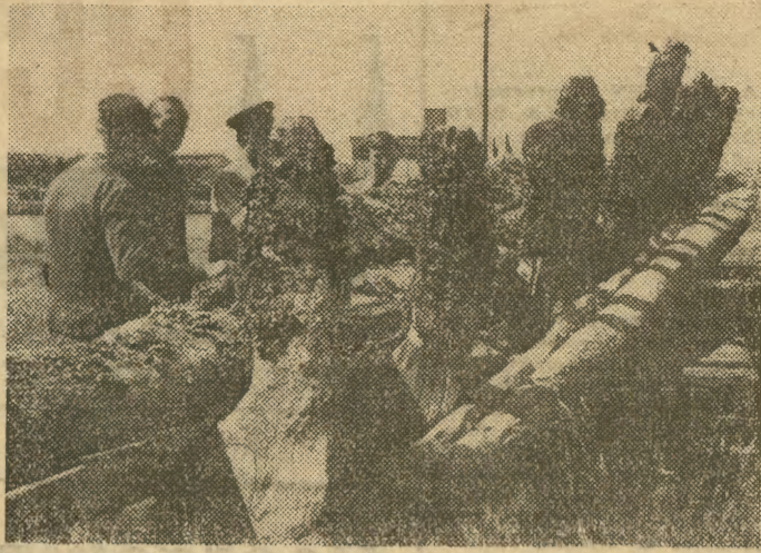
Baza Opakowania Nawigacyjnego Gdańskiego Urzędu Morskiego...

G. Husak i L. Svoboda przyjęli gen. A. Jepiszewa