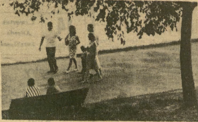
Odkąd bulwary Wisły pod Wawelem wypiękniały, coraz więcej krakowian udaje się tu na spacer.

Na niedzielę 17 bm. Krakowski Teatr Muzyczny — Opera przygotowuje kolejne wystawienie w Zakopanem — w górskim plenerze na stadionie pod Krokwią — „Halki” Moniuszki, w inscenizacji Br. Dąbrowskiego, w wykonaniu solistów, chóru, baletu i orkiestry naszego Teatru pod kierunkiem dyrygentem Kazimierzem Kordą. (JP)