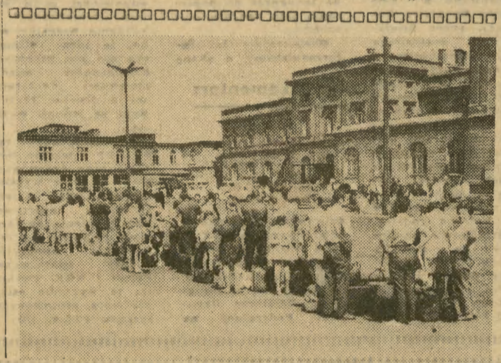
65 osób w kolejkę do taksówki, to swoisty rekord. Dziwi nas, że Zrzeszenie Taksówkarzy udziela urlopu tak dużej liczbie kierowców w miesiącach wakacyjnych.

W tym roku poważnemu remontowi poddany będzie Urząd Pocztowy przy ul. Zakopiańskiej. Nastąpi jego modernizacja, a także poszerzony on będzie o sąsiednie pomieszczenia.