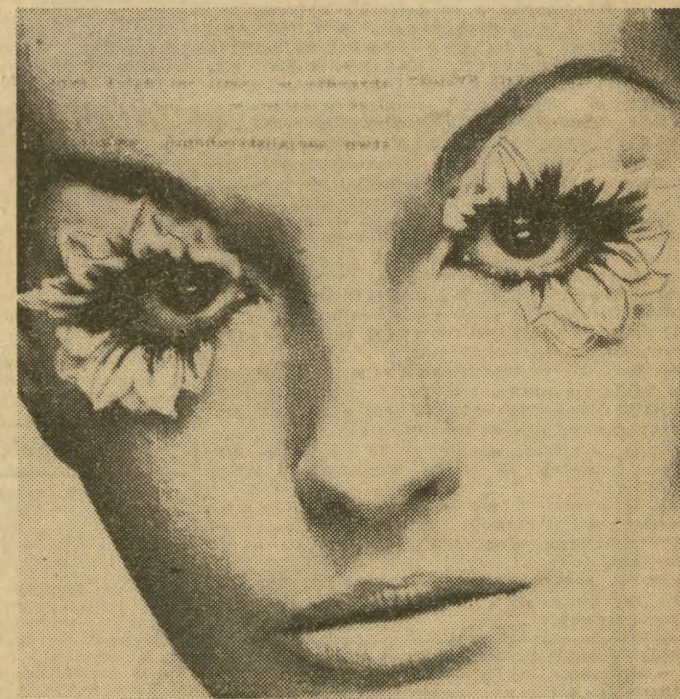
Po sztucznych rzesach przysłała koleją sztuczne kwiaty. Co bardziej ekstrawaganckie mieszkanki Londynu ozdabiają oczy płatkami sztucznych kwiatów przetykanych gęstymi rzeszami z prawdziwych włosów. Duże poświęcenie, ale jaki efekt!

Jak kształtują się ceny daczę? W bardzo atrakcyjnej miejscowości, nad rzeką i blisko lasu płaci się za cztery miesiące pobytu na letnisku 200—250 rubli. Tak przeciętnie koszt daczę kształtuje się jednak gdzieś około 150 rubli. Sam wynajęty domek na miesiąc w Zwienigorodzie (60 km od Moskwy), co prawda blisko szosy, ale za to nieopodal rzeki, za 30 rubli. A miejscowość jest naprawdę przepiękna. To tu, w maleńkiej cerkiewce pracował Andrej Rublow, zachowała się polichromia jego pędzla. To tu utrwał piękno rosyjskiego krajobrazu dziewiętnastowieczny pejzażysta — Lewitan. Do naszych czasów dochowała się zresztą jego daczę, dziś będąca obiektem muzealnym. Jadę więc pod Moskwę! ZBIGNIEW PODGÓRZEC