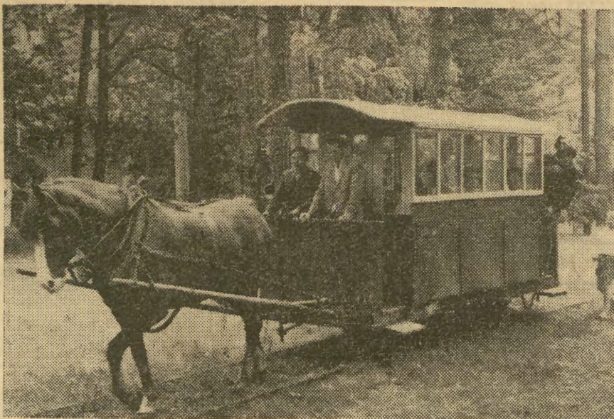
Tempo nie jest zawrotne... ale za to jaka frajda. Taka podróż konnym tramwajem, podczas której pasażerowie mają dość czasu, aby wyjść do lasu na pogawędke, ma wielu zwolenników. Zainteresowanych kierujemy na stację kolejową w Mroczach (pow. Mińsk Mazowiecki). Stąd bowiem prowadzi 2 1/2-trasa konnego tramwaju do Rudki Sanatoryjnej.