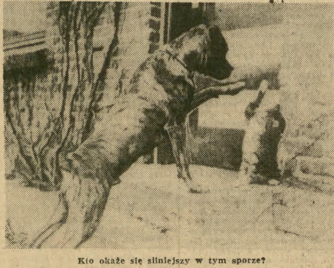
Kto okaże się silniejszy w tym sporze?