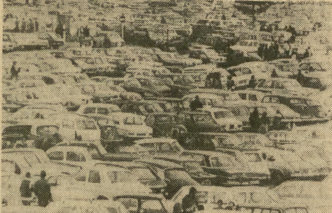
Kierowcy tych licznych samochodów stłoczonych na parkingu w Monthlery (Francja) przyjechali tu, aby obejrzeć wyścig na 1000 km. Mogą oni jedynie pozazdrościć swobody ruchu i rozwijania dużych szybkości zawodnikowi na betonowym torze. Po zakończonym wyścigu rozjadą się zatłoczonymi drogami, utkną w korkach ulicznych, marząc, aby choć raz wykorzystać moc swoich silników.

Badacze gdańscy zwracają uwagę na brak środków zastępujących papieros — postulują m. in. wprowadzenie leków odkażających górne drogi oddechowe i witaminizowanych (np. w formie estetycznych landrynek).