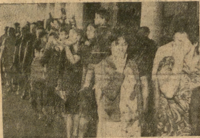
Tysiące moskwičan oddało 1 km. ostatni hold bohaterom Kosmosu — członkom załogi „Sojuz-11”. Do Centralnego Domu Armii Radzieckiej, gdzie wystawiono trumny z ciałami kosmonautów, ustawiała się wielokilometrowa kolejka mieszkańców stolicy Związku Radzieckiego

W nocy ze środy na czwartek w kilku miejscowościach szwajcarskich spadł obfity śnieg. Zasypane zostały przełęcze Nufenen, Simplon i Susten. W celu przywrócenia komunikacji trzeba było uruchomić pługi śnieżne.