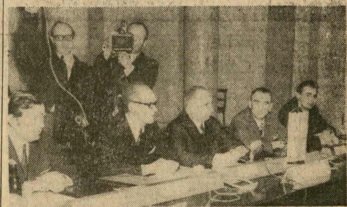
Na zdjęciu: delegacja polska z jej przewodniczącym, ministrem spraw zagranicznych PRL — S. Jędrzycho wskim (w środku).