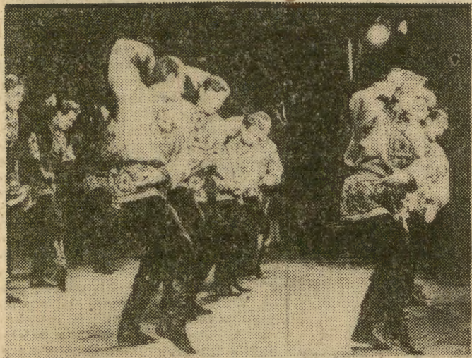
Radziecki zespół Piatnickiego słynny jest na całym świecie.