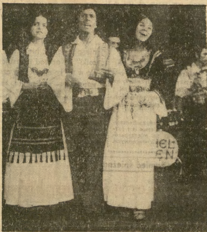
W 1970 r. powstał na Wybrzeżu, gdzie znajduje się największe skupisko uchodźców politycznych z Grecji...