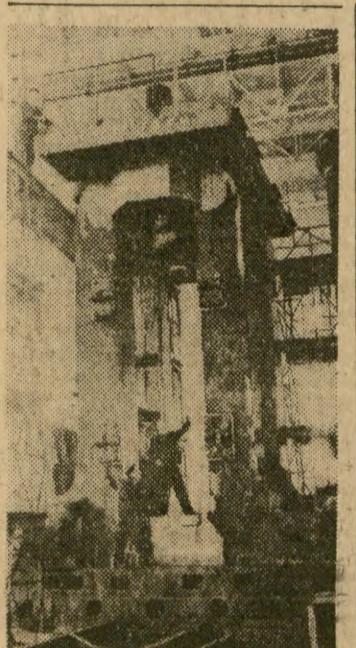
Załoga Uralskiej Fabryki Maszyn wykonuje zamówienie metalurgów Koreańskiej Republiki Ludowo-Demokratycznej. W halach fabryki powstaje zespół walowniczy dla koreańskiego przemysłu samochodowego. Zmontowano już pierwszą klatkę walowniczą (na zdjęciu).

Dziś w południe, w sali konferencyjnej Naczelnej Organizacji Technicznej rozpoczęło się wspólne posiedzenie kolegów Zjednoczenia Przemysłu Azotowego i Zjednoczenia Przemysłu Rafinerii Nafty.