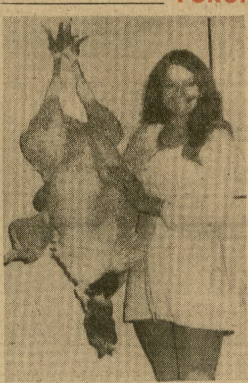
Tradycyjną potrawą w czasie Świąt Bożego Narodzenia w Anglii jest indyjkę, nie więc dziwnego, że hodowcy drobiu prześcigają się w dostarczaniu na rynek jak największych okazów. Indyk pokazany na zdjęciu pobit tegoroczny rekord — jego waga wynosi prawie trzydzieści kg.

Minister spraw wewnętrznych Bangla Desz A. Kamruzzaman zakomunikował, że masowa repatriacja przebywających w Indiach uchodźców z wschodniopakijskich, rozpocznie się 1 stycznia 1972 roku.