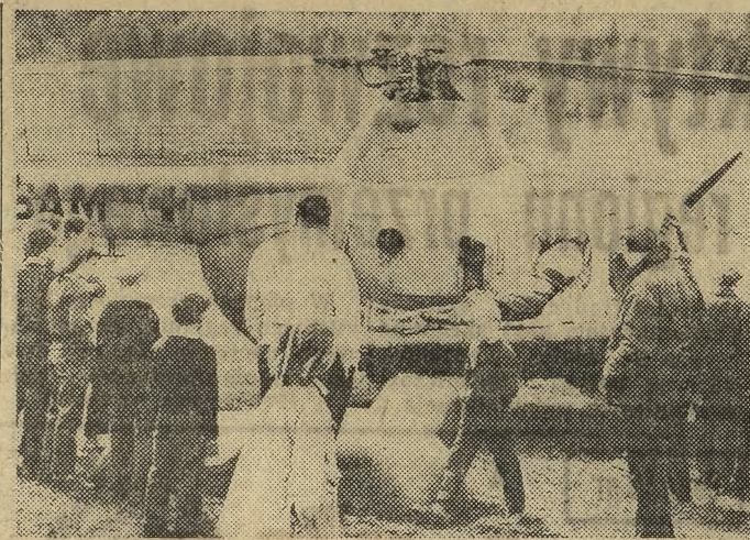
Mija 12 lat od zorganizowania w Bieszczadach oddziału Zespołu Lotnictwa Sanitarnego. Ze względu na trudności dojazdu do wielu osad bieszczadzkich, oddział wyposażony został w helikoptery. Bazą „Bieszczadzkiego Pogotowia Lotniczego” były przez rok Ustrzyki Dolne, a obecnie jest Sanok. Z sanitarnego lotniska w Sanoku codziennie startuje śmigłowiec, aby nieść pomoc lekarską do trudno dostępnych osad leśnych oraz wsi w powiatach Sanok, Lesko i Ustrzyki Dolne.

Okazało się, że pani Irwing otworzyła konto w jednym z banków w Zurychu na nazwisko H. Hughesa, wpłaciła na nie otrzymane od męża czeki, a potem jako... Hilga Hughes podjęła pieniądze na podstawie fałszywego paszportu. Zupełnie niespodziewanie miliardier zmienił miejsce pobytu. Wsiadł do prywatnego samolotu i wyładował w Vancouverze. W zeszłym tygodniu, jego wysłannik zarezerwował 19 i 20 piętro hotelu w centrum miasta, zmieniając je w bastion nie do przeniknięcia. Nawet dyrektor hotelu nie oglądał miliardera. Przypuszcza on, że towarzyszy mu 15-osobowa świta. Jeden z