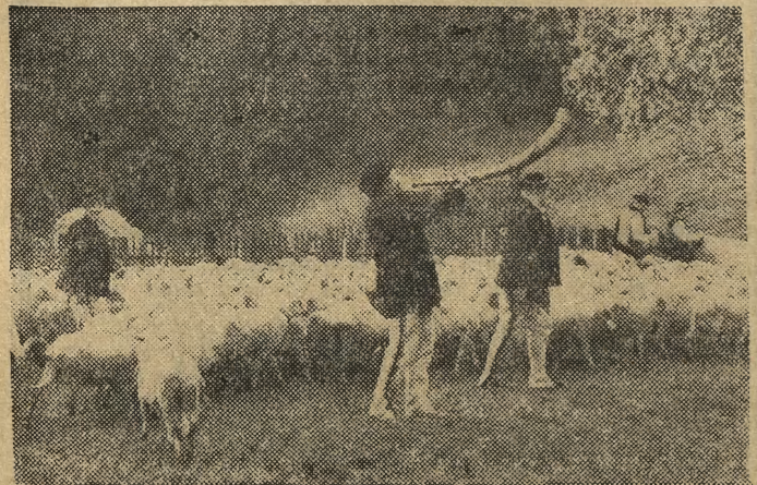
Zakończyły się uroczystości, owce dotarły już na hale w Jaworkach. Rozpoczynają się pracowite miesiące dla baców i juhasów. O Wielkim Redyku w Szczawnicy piszemy na str. 3.

W Waszyngtonie w dniach 8—12 maja odbędzie się pierwsze posiedzenie ekspertów obu krajów w tej sprawie.