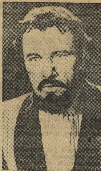
ZE SWIATA FILMU Znany aktor angielski Richard Burton w swoim najnowszym filmie występuje w roli Sinobrodego (na zdjęciu).