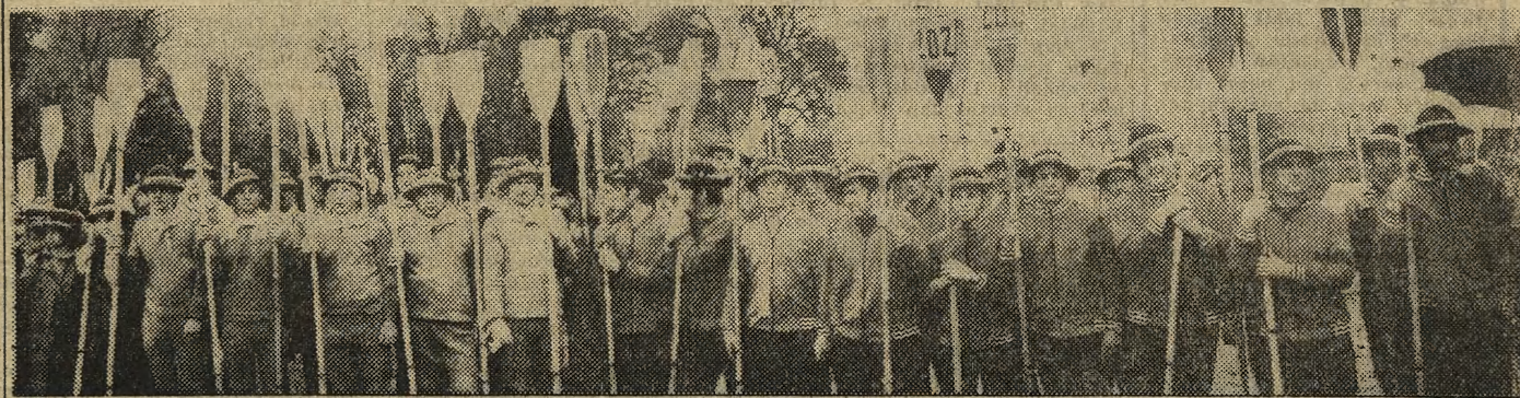
Jak co roku na stadionie sportowym „Podhala” w Nowym Targu zjawili się około 2 tys. wodniaków — wszyscy w góralskich kapeluszach, barwnej ozdoby tegorocznej imprezy — by wziąć udział w emocjonującym pojedynku z bystrą górską rzeką.