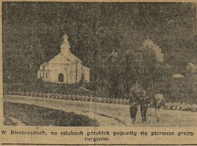
W Bieszczadach, na szlakach górskich pojawiły się pierusze grupy turystów.

Tej tematyce poświęcone są w głównej mierze dzisiejsze obrady Konferencji Sprawozdawczo-Wyborczej Krakowskiego Okręgu Zw. Zaw. Pracowników Leśnych i Przemysłu Drzewnego. (hs)