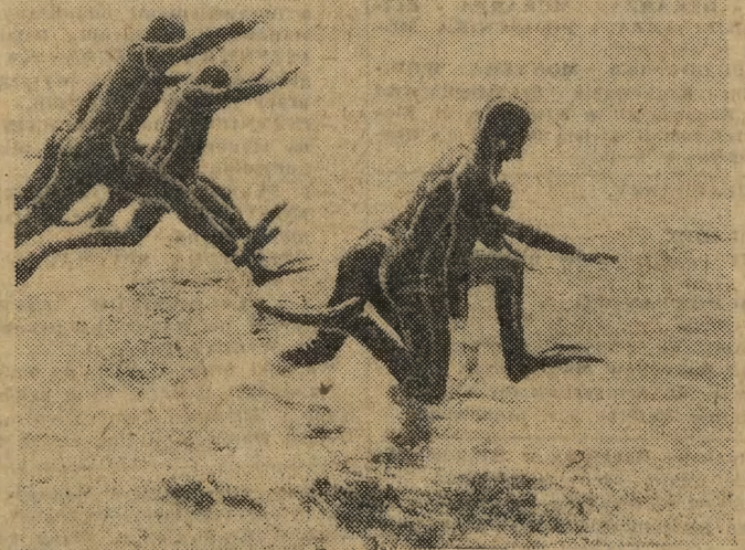
Ostatnio najlepszy w kraju klub pływacki „Płetwal” przy oddziale PTK w Giżycku, zorganizował pokazy. Na zdjęciu: skok desantowy.