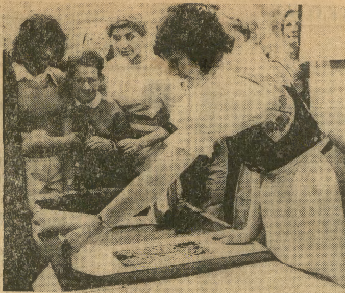
Pokaz ręcznego druku tkanin stemplem odtworzonym z XIX-wiecznych wzorów stosowanych na terenie Opolszczyzny.

W dniu dzisiejszym zakończy obrady w Szczecinie stała grupa robocza do spraw współpracy przemysłów motoryzacyjnych Polski i Związku Radzieckiego. Celem obrad, które toczyły się w Fabryce Mechanizmów Samochodowych „Polmo”, jest przedyskutowanie problemów dalszego rozszerzenia współpracy gospodarczej i handlowo-technicznej przemysłów motoryzacyjnych obu krajów.