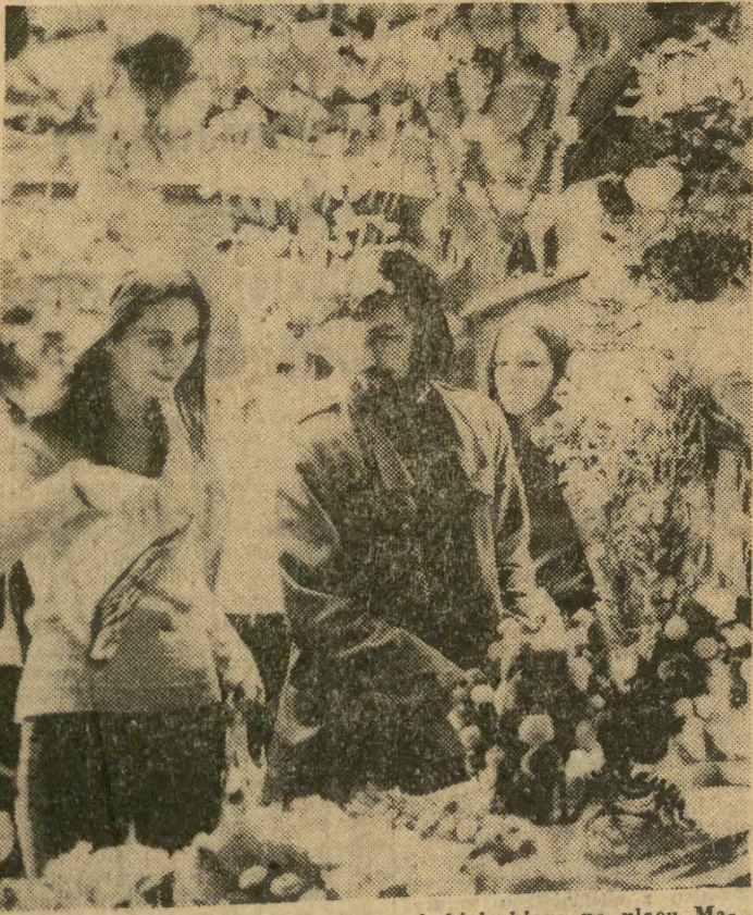
„Pajaki”, kwiaty i wycinanki z woj. kieleckiego na placu Mariackim.

Jutro pogoda w rejonie Krakowa kształtować się będzie pod wpływem wyżu. Zachmurzenie niewielkie. Rano zamglenia. Wiatry północne i północno-wschodnie 1-3 m/sek. Temperatura dnem od plus 25 do 28, nocą od 16 do 13 st. C.