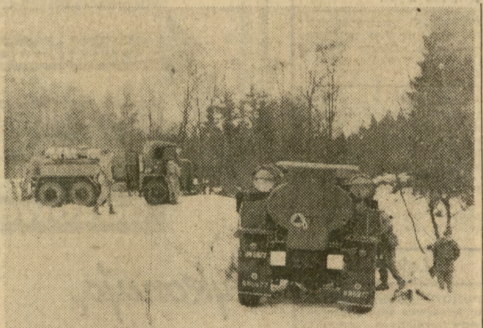
Jeden taki samochód-kombajn chemiczny może nie tylko skutecznie odkazić teren ale również przygotować w ciągu kilkunastu minut gorącą kąpiel dla żołnierzy...