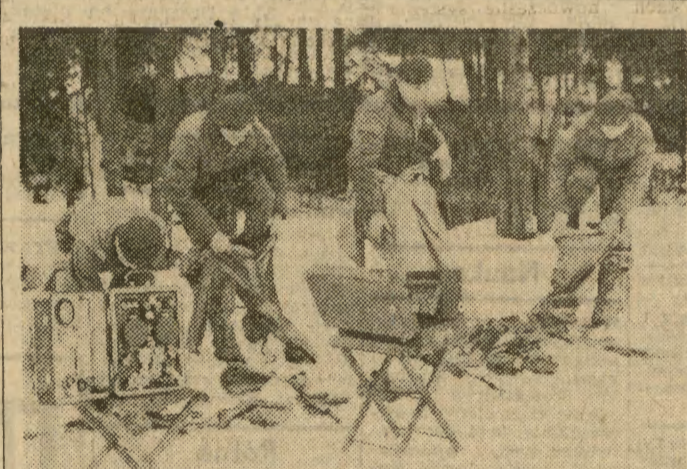
Ruchy skrzepowane zimowym umundurowaniem ale ćwiczenie trzeba wykonać sprawnie, w przepisowym czasie.

Żołnierze 6 Pomorskiej Dywizji Powietrzno-Desantowej zdobyli na zimowych ćwiczeniach wiele nowych umiejętności, mroźne dni w Beskidach owocować będą w trakcie całorocznej służby, mniej będzie urazów przy skokach ze spadochronem, sprawniejsi fizycznie żołnierze. (And)