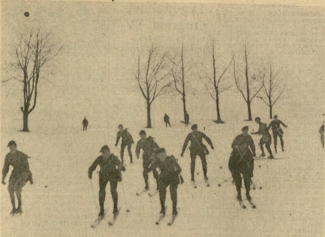
Na „ośle łączce” od rana do zmroku ruch. Tu uczą się jazdy na nartach ci żołnierze, którzy po raz pierwszy w wojsku zetknęli się z białym szaleństwem...