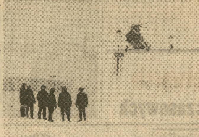
Daleki Wschód stał się największą w ZSRR bazą wydobycia ropy naftowej i gazu ziemnego. Jednym z zadań bieżącej 5-latk jest znaczne zwiększenie wydobycia ropy i gazu z nowych złóż Tidemia i Manguszaku. Zdjęcie wykonano na terenie złóż mamontowskich, jednych z największych w Zachodniej Syberii.

Towarzysze węgierscy przekazali zaproszenie dla polskiej delegacji partyjno-rządowej do złożenia wizyty w WRL. Zaproszenie zostało przyjęte z zadowoleniem.