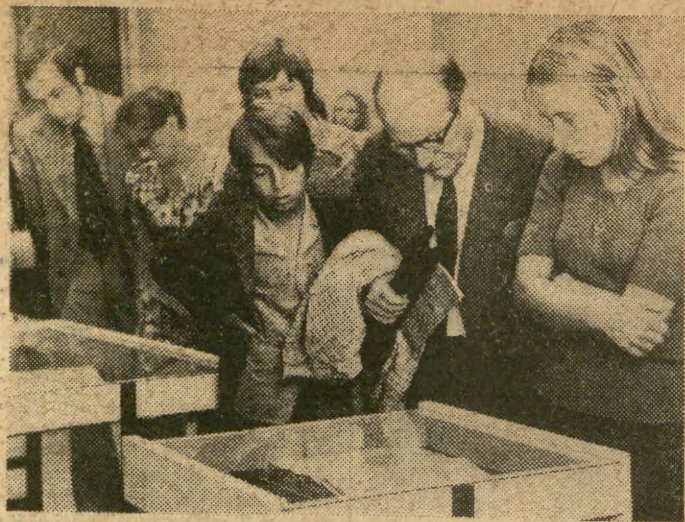
Chłopnie ustawiali się w kolejce zwiędzający, by zobaczyć rękopis dzieła „De revolutionibus”.