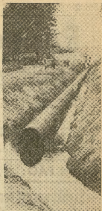
W ciężkich warunkach terenowych prowadzi KPRI budowę rurociągu w obrębie naszego miasta. Ale prace przebiegają sprawnie.

nastu lat wydarzenia, wskazujące na poprawę stosunków między USA i ZSRR, wydarzenia poważnie zmniejszające groźbę wojny na świecie. Podkreśla się, iż wydarzenia z zakresu dwustronnych stosunków radziecko-amerykańskich nie stanowią jedynych oznak umiagodzenia się procesu odprężenia na świecie. Przedmiotem komentarzy są rozpoczynające się prace II etapu Konferencji w sprawie Bezpieczeństwa i Współpracy w Europie, których rezultat będzie miał niewątpliwie wpływ na XXVIII sesję ONZ.