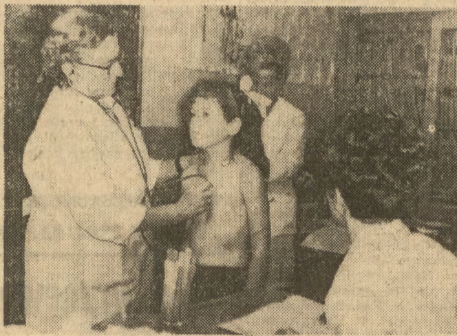
We wsi Wolica nowohucy lekarze przebadali 120 dzieci.

wraz z kilkunastoma tysiącami mieszkańców miasta — członkami z organizacji fabrycznych, z (Dokończenie na str. 2)