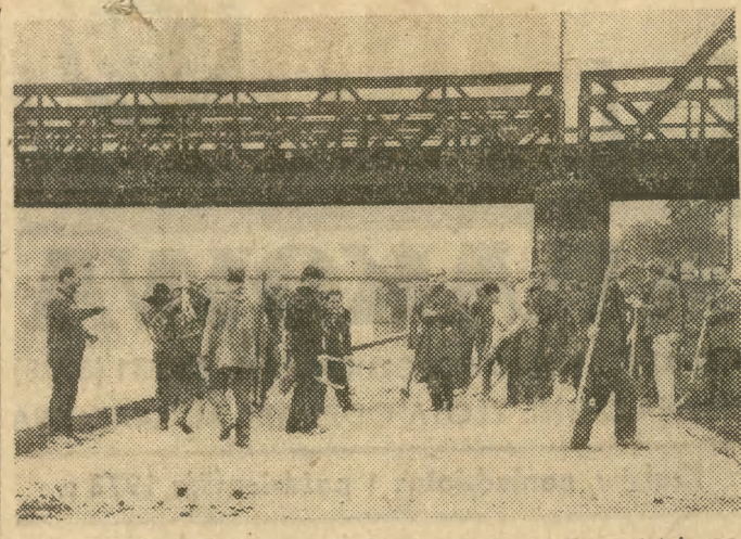
Bulwar nad Wisłą - praca skończona, jeszcze tylko ostatnie poprawki i pracownicy WRN oceniają efekt swoich wysiłków.

Wreszcie w wykonaniu poprawki wprowadzonej przez Sejm do art. 34 Konstytucji, Rada Państwa określiła przypadki, w których w nadchodzących wyborach wybrane zostaną wspólne rady narodowe dla miasta stanowiącego powiat i sąsiadującego z nim powiatu.