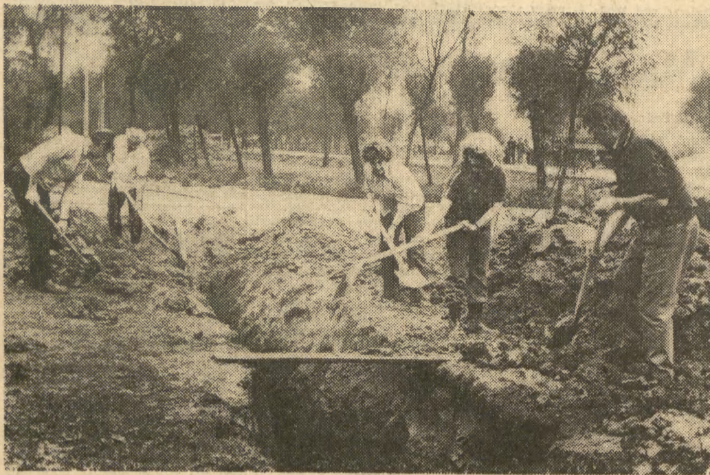
Woda dla wsi Chalupki — pracownicy ZBP „Południe” są już na etapie zasypywania ziemią wykopów, w których ułożono rury wodociągowe.

Nowy rok akademicki będzie początkiem przygotowań do gruntownej przebudowy struktury nauczania i organizacji szkoły wyższej, by jak najszybciej dojść do takiego modelu uczelni, w którym nastąpi pełna integracja nauczania, badań i wychowywania.