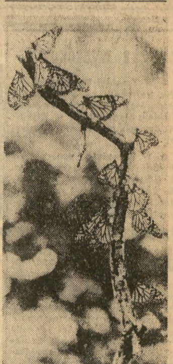
Gałzka pełna motyli...