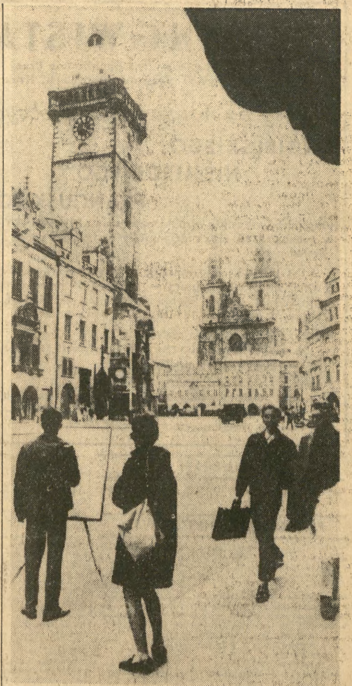
Wprawdzie drzewa już straciły liście, zapanowała szara jesień, ale urok Złotej Pragi przyciąga - mimo złej pogody - zarówno turystów jak i malarzy. N/z: fragment staromiejskiej Pragi z Ratuszem i kościołem Tyńskim.

nnych napojów alkoholowych, to jest o 15 tys. ton więcej niż w roku 1972. Tegoroczny eksport będzie wyższy o 10 proc. Wśród największych odbiorców win jugosłowiańskich obok NRF, NRD, Związku Radzieckiego, Anglii i Szwajcarii, jest także Polska.