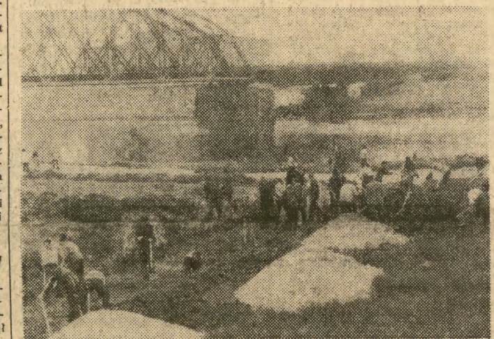
Krakowska ekspedycja zabiera ze sobą kilkadziesiąt pojemników

wplyw wywarła wojna i okupacja na psychikę człowieka? Przedstaw zagadnienie na podstawie znanych ci utworów literatury polskiej. 5. Problem odpowiedzialności moralnej człowieka za własne czyny na przykładzie współczesnej powieści polskiej i obcej.