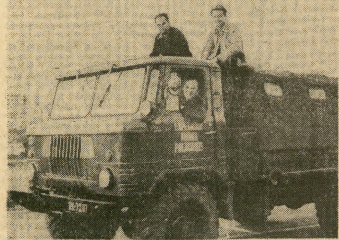
Wyrusza „czółwka” wyprawy „ANDY 75”

Grupa Indian z plemienia Siuksów opanovała gmach Kombinatoru mięsnego w mieście Wagner w stanie południowa Dakota na znak protestu przeciwko bezprawnym poczynaniom miejscowych władz wobec rdzennej ludności USA. Policja użyła gazów łzawiących. Aresztowano 8 Indian.