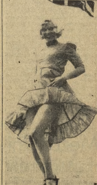
Amerykańska aktorka Sandra Dickinson zagra rolę swojej nieżyjącej już koleżanki po fachu Marilyn Monroe w sztuce pod tytułem „Legenda”, której premiera odbędzie się wkrótce w Londynie.

BONN 97-letni mieszkaniec wioski Huchem-Stammeln (RFN) po długim namyśle postanowił zmienić swój stan cywilny. Jest to już trzecia decyzja tego rodzaju w jego życiu. Jego obłębienica liczy 54 lata.