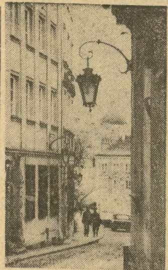
Staromiejski zaułek Warszawy.