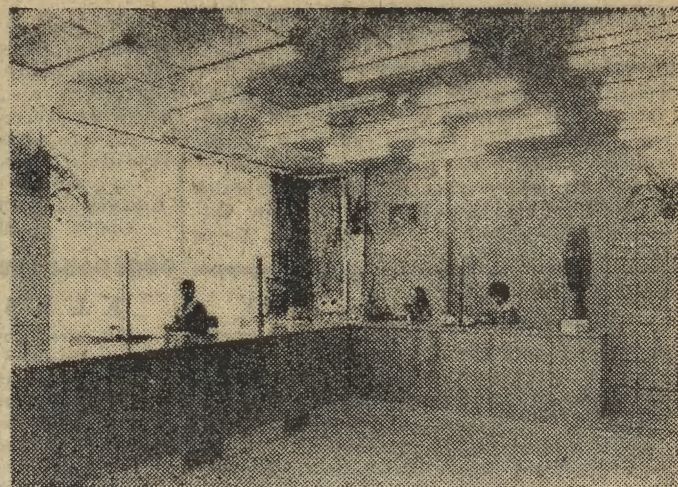
Os. Azory otrzymało nowy urząd pocztowy. Mieści się on w Pawilonie handlowym przy ul. Radzikowskiego 29...