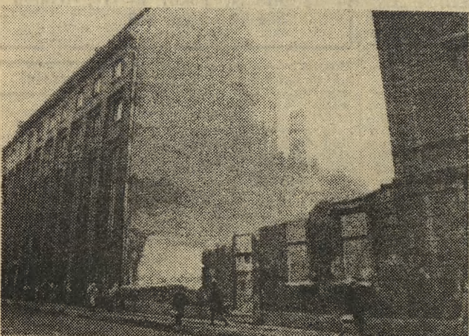
Rozbiórka starej rudery przy ul. Filipa, na miejscu której wzniesie się dom dla małżeństw kolejowych...