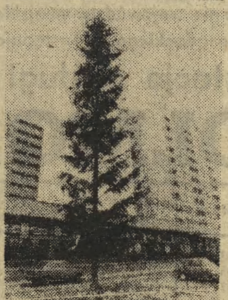
Najwyższa w Krakowie i chyba w kraju bo sięgająca piętego piętra choinka „wyrosła” przed sklepem „Pewexu” przy ul. 18 stycznia. Niezwykle były kłopoty z opuszczeniem ściętego drzewa na miejscu wyrębu w Nadleśnictwie Myślenice...

17 Start (Kr). 18 Skrzynka interwencji (Kr). 18.10 Pol. piosenki (Kr). 18.24 Pogoda (Kr). 18.25 Język niemiecki. 18.40 Tygodniowy przegląd audycji oświat. i popularyzacyjnych. 19 Poradnik Językowy. 19.15 Język rosyjski. 19.30 Płyty, o których się mówi (stereo) (Kr). 20.38 Festiwal Tibora Vargi w Sion w 1976 (stereo) (Kr). 22.15 Krajobrazy historyczne. 22.35 Melodie filmowe.