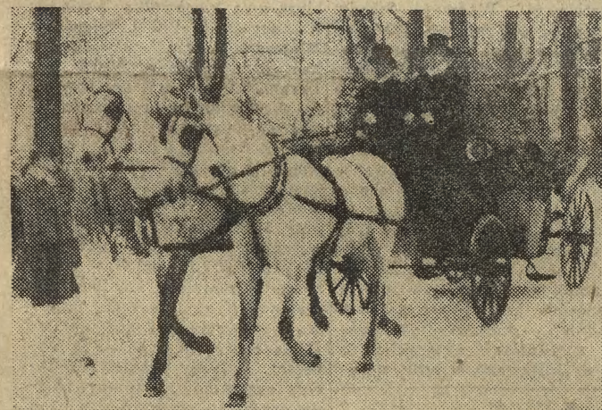
Kręcone między innymi w Łazienkach sceny do filmu J. Kawalerowicza pt. „Śmierć Prezydenta” wzbudziły zrozumiałe zainteresowanie spacerujących.

RZYM Z więzienia w miejscowości Cuneo w pin-zach. Włoszech na wolność wydostało się 4 więźniów. Dwu z nich schwymano i ponownie znajdują się oni za kratkami; dwaj pozostali uszli pognoni. Stan bezpieczeństwa we włoskich więzieniach jest powodem coraz większego zaniepokojenia opinii publicznej. W 1976 r. z więzień we Włoszech uciekło łącznie 357 skazańców, a w pierwszym tygodniu br. zanotowano dwie ucieczki z udziałem 17 kryminalistów.