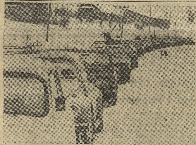
Zajeżdżamy nasze góry, oj, zajeżdżamy...

Samochodowe silniki wysokoprężne (Diesla) oraz turbiniowe (Yankle'a) będą mogły być w przyszłości napędzane sproszkowanym drewnem. Umożliwi to wynalazek szwedzkiego inżyniera — Jana Aabona. Skonstruował on specjalny gaźnik, który — jak twierdzi — może być zastosowany w konwencjonalnych silnikach wysokoprężnych, zamiast pompy wtryskowej. Nowe rozwiązanie pozwoli wykorzystywać jako paliwo te zasoby lasne, które w praktyce nie znajdują innego zastosowania.