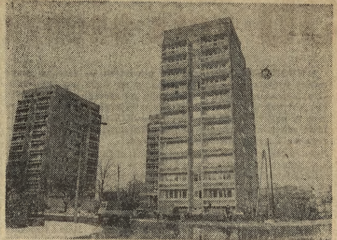
Zmienne pogoda nie powstrzymuje tempa prac budowlanych. Na ukończeniu są kolejne wysokościowce przy ul. Grochowskiej.

* 17 Kwadrans akademicki (Kr). 17.15 Koncert rozrywkowy (Kr). 17.45 Notatnik Kulturalny (Kr). 18.15 Po jednej piosence (Kr). 18.24 Pogoda (Kr). 18.25 Język niemiecki. 18.40 S.O.S. dla biosfery. 19 Jak działać sprawnie? 19.15 Język angielski. 19.30 Hase - Porsugnaco e Grilletta (Stereo - Kr). 20.41 Ravel - Kwartet smyczkowy. F-dur. 21.10 Laureaci chopinowscy - M. Pollini. 22.15 Studium wiedzy polit.-spol. 22.30 Międzynarod. Trybuna Kompozyt. - Paryż 76.