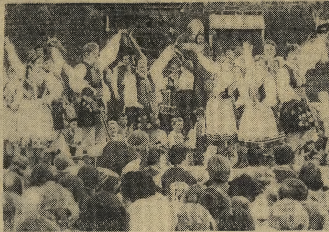
Popołudnie pierwszomajowe upłynęło pod znakiem zabaw i występów. Tlumnie przybyli krakowianie na Rynek Gł., gdzie na estradzie przed wieżą Ratusza koncertowały zespoły folklorystyczne.