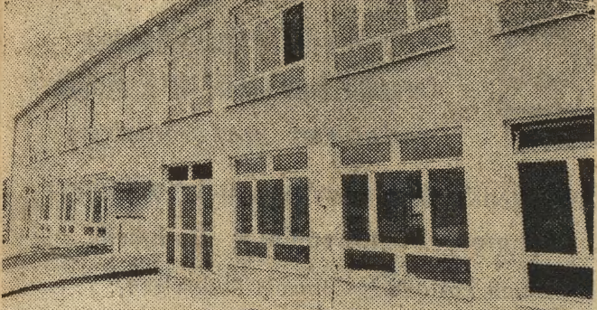
Tak prezentuje się z zewnątrz osiedlu Nad Potokiem w Prokocimiu Nowym.