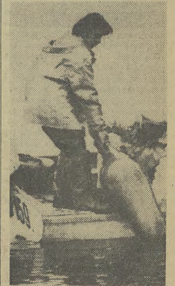
Rybaicy gruzińscy wyłowili w czasie polowań na Morzu Czarnym amforę pochodzącą prawdopodobnie z I lub II w. p.n.e. Amfora, wysokości 115 cm, ma pojemność 32 litrów.

PARYŻ Premier Francji — Raymond Barre przybył z oficjalną wizytą do Pekinu.