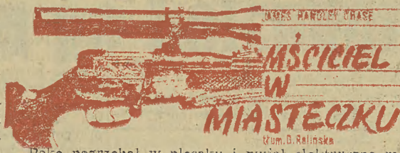
KRIMINALNY CHASE MŚCICIEL W MIASTECZKU Rum. B. Ralska

Poke pogrzebał w plecaku i wyjął elektryczną maszynkę do golenia i kieszonkowe lusterko. Oparł się o ramie okienną i zabrał się do golenia.