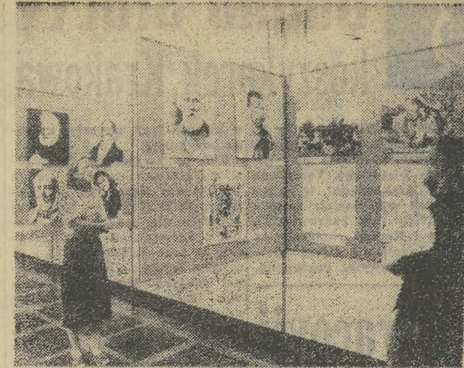
W Galerii Klubu Międzynarodowej Prasy i Książki w Nowej Hucie (rwa wystawa fotograficzna „190 rocznica wyzwolenia Bułgarii z niewoli tureckiej”).

Jak więc wynika z przytoczonych liczb — nie ma zbyt wielu powodów do optymizmu. (ja)