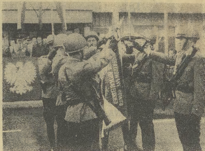
Ślubowanie funkcjonariuszy ZOMO.

A zatem — festiwal „Dni Muzyki Organowej 1978” mamy już poza sobą... Ostatnim jego akordem był sobotni koncert Filharmonii, gdzie w programie umieszczono muzykę dwóch Francuzów: Kamila Saint-Saensa (III symfonia) i Gabriela Faure („Requiem”).