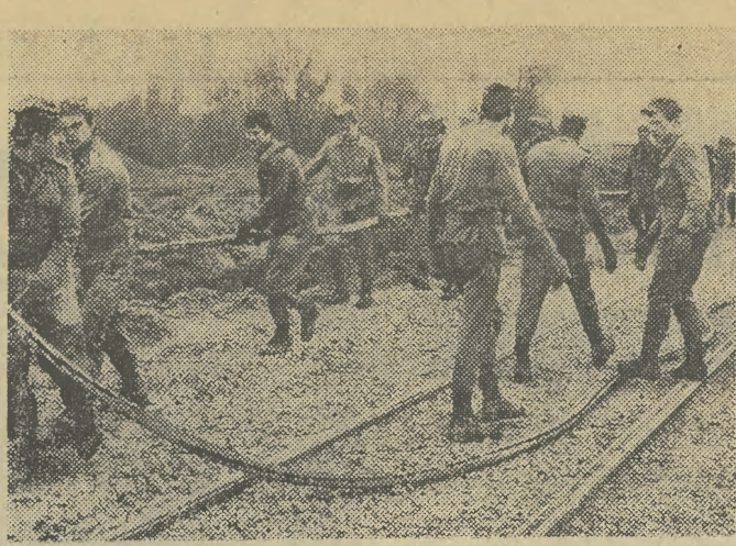
Dobłą organizacją pracy wykazali się junacy 17-2 OHP, którzy rozciągali kabel wysokiego napięcia.

JUTRO pogoda w rejonie Krakowa kształtować się będzie pod wpływem podwyższonego ciśnienia. Zachmurzenie umiarkowane, okresami duże z przelotnymi opadami deszczu o charakterze burzowym. Wiatry zmienne 3—6 m/sek. Temperatura dniem plus 12—17, minimalna nocą plus 6—2 st. C. (w)