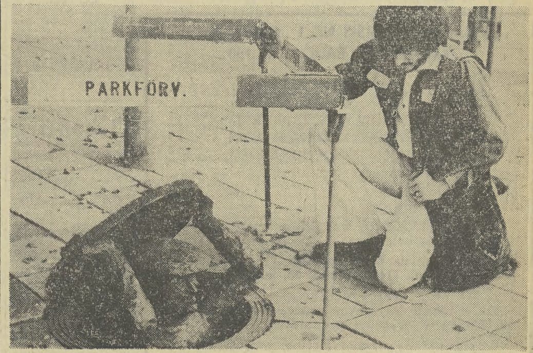
W samym śródmieściu Sztokholmu umieszczono oryginalną rzeźbę z brązu, przedstawiającą robotnika we władze kanału. Przypomina ona niedawną głośną aranżację rzeźbiarza Kaliny na ul. Świętokrzyskiej w Warszawie.

Strug, o całkowicie metalowej konstrukcji z udoskonalonym systemem wymiany ostrzy oraz piłę-płatnicę z brzeszczotem ze stali stopowej — zaprezentował „Stanley”. Inna firma — „Triplex” wystąpiła m. in. z miniaturowymi narzędziami zasilany energią z baterii elektrycznej oraz przyborami do wykonywania w bardzo prosty sposób, szybko i dokładnie, połączeń stolarskich — wpustowych i kołkowych. Nie zapomniano także o urządzeniach do odprowadzania i gromadzenia wódrów.